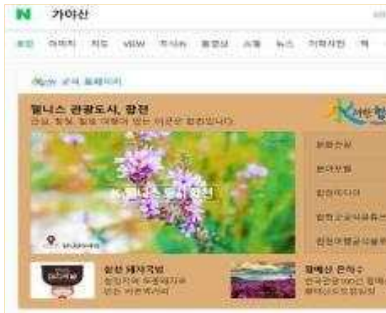
- 네이버(PC형) -