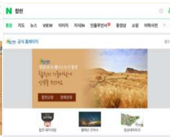
- 네이버(모바일형) -