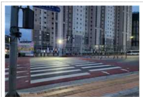
<활주로형 고원식 횡단보도>