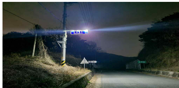
<일몰 후 야간조명장치 점등>