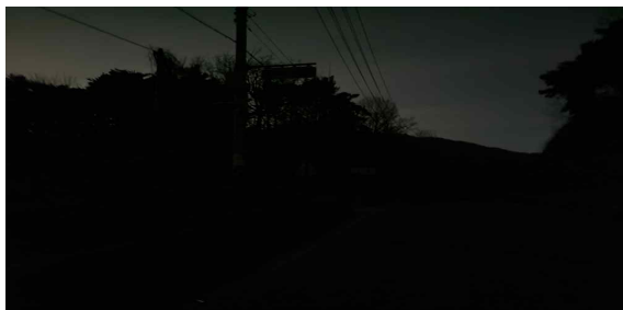
<일몰 후 시인성 불량>